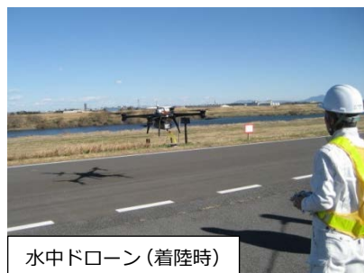
水中ドローン（着陸時）