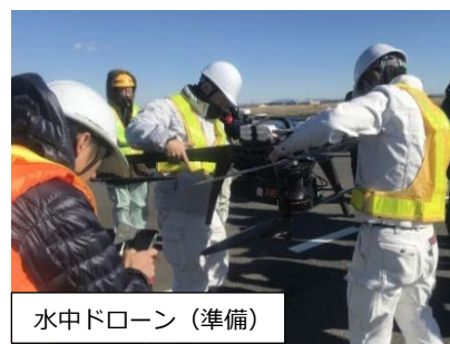
水中ドローン（準備）