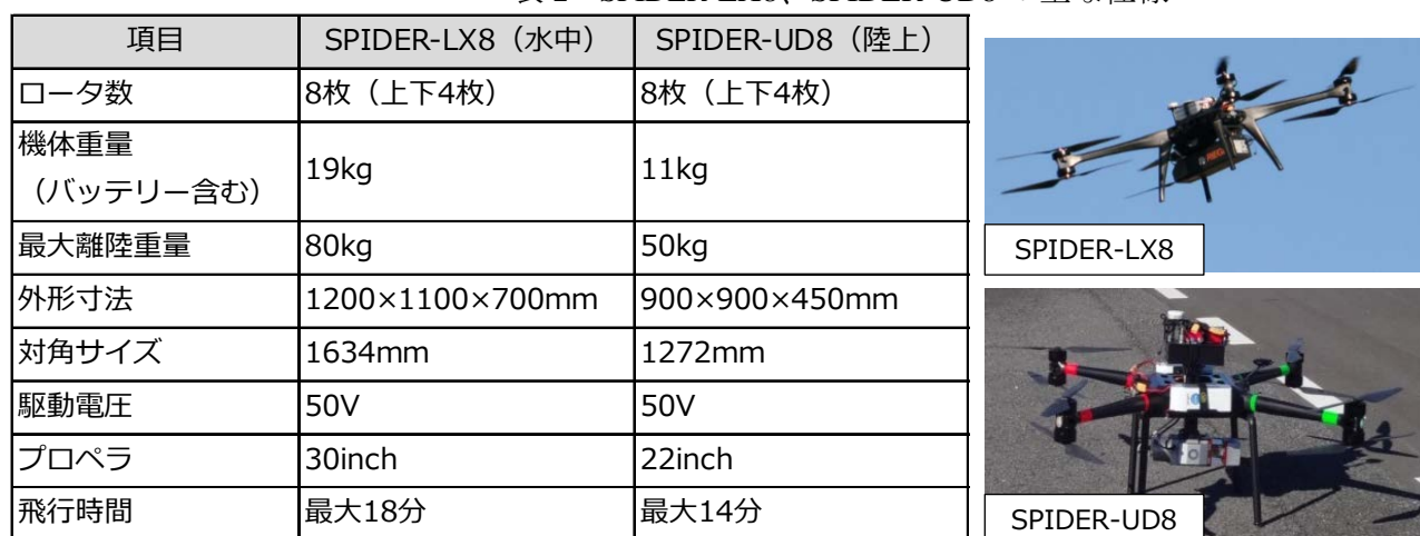
表 2 SPIDER-LX8、SPIDER-UD8 の主な仕様