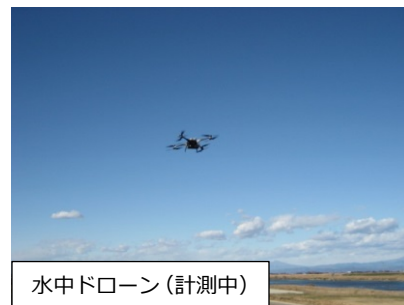
水中ドローン（計測中）