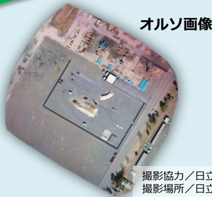
撮影場所/日立建機ICTデモサイト