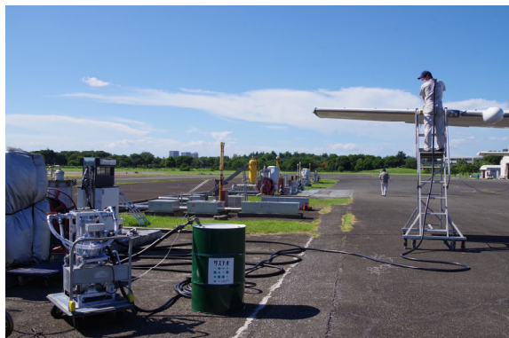
給油の様子（石野礦油株式会社による給油）

アジア航測は、これまで自社保有の機体で2度のユーグレナ社が供給する SAF 利用飛行を実施し（2022年3月17日、6月23日）、SAF 利用に関する燃料管理や給油、点検等における作業手順や安全管理に関するオペレーションを確認してきました。今回のフライトは、アジア航測の受託業務においても初の SAF 利用で、岩手県遠野市の「森林資源計測業務」の一環として、同市のご理解とご協力を得て実現したものです。