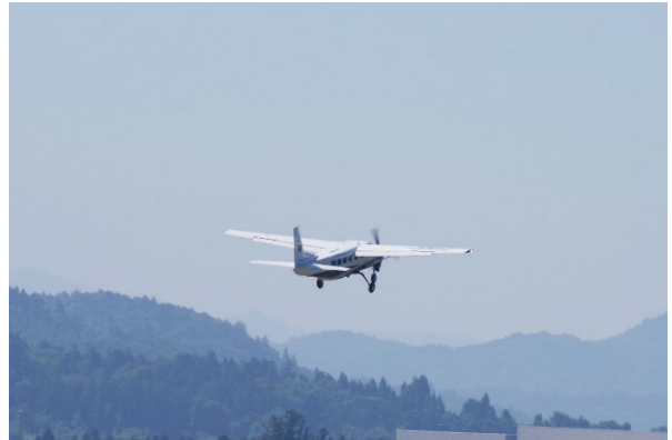
SAFを使用したフライト