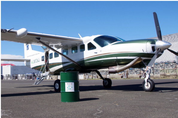
アジア航測保有の JA12AJ

アジア航測株式会社（本社：東京都新宿区、代表取締役社長 畠山仁、以下「アジア航測」）と株式会社ユーグレナ（本社：東京都港区、代表取締役社長：出雲充、以下「ユーグレナ社」）は、ユーグレナ社の製造・販売するバイオジェット燃料（以下「SAF」）「サステオ」 ※1 を使用して、2022年7月31日に3度目のフライトを行いました。SAF燃料でのフライトは、東京都の運営する調布飛行場では今回が初の取り組みとなります。