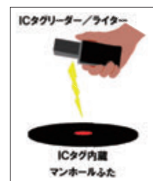
図3 読取りイメージ

ICタグ・ICタグ読み取り装置・PC・水道施設管理システムのそれぞれの通信等の仕組みを構築し、簡単に特定できる仕組みを確立するに至りました（図3、4）。