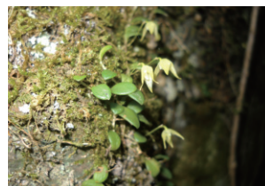
図2 確認した重要種の例 (トノサマガエル(左)、マメツタラン(右))