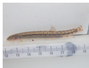
図3 魚類への影響検討 (アジメドジョウ(上)と 水位変動範囲予測結果(左))

最後に、本業務の遂行にあたり、新丸山ダム環境調査検討委員会の先生方、国土交通省中部地方整備局新丸山ダム工事事務所関係者の皆様には多大なるご指導、ご協力をいただきました。ここに改めて御礼申し上げます。