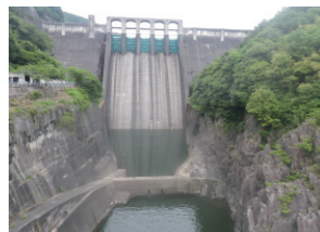
図1 現在の丸山ダム (やや下流により大きな新丸山ダムが建設されます。)

本業務は、事業再開に伴い、中断期間中の各種レッドリストの更新などをふまえ重要種の再調査や事業による影響の再検討を行ったものです。ここでは重要種調査と、重要な魚類への影響検討について紹介します。