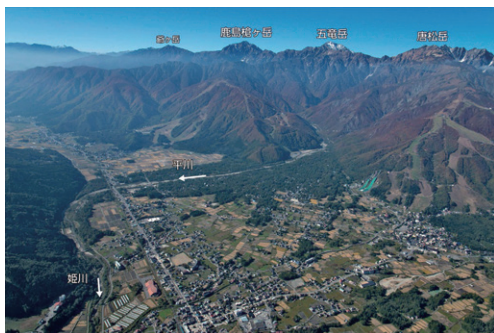
図1 マップに掲載した斜め写真の例

流域情報マップの原稿と資料集を作成するため、対象となる管内の12の主要支川流域の上流域の状況把握と、今後の事業実施を想定し、新設・改築の施設計画地と顕著な斜面崩壊などがみられる箇所、回転翼機（ヘリ）による斜め写真撮影を行いました。流域情報マップ掲載時には、場所がイメージしやすいよう写真上に河川名や施設および山名の注記を加えました（図1）。